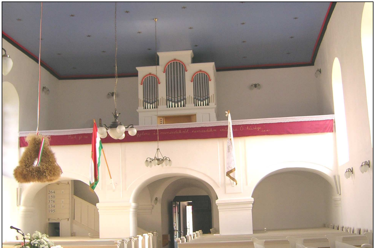
Az új orgona a templom egyik ékessége lett

Isten nagy neve legyen áldott a tuzséri orgonáért!